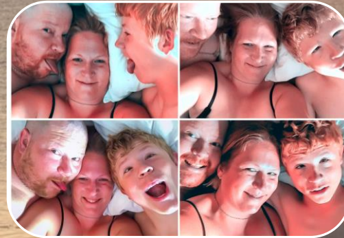
En annorlunda familj