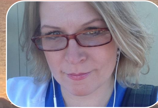
Legitimerad sjuksköterska 2005