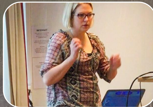
Föreläser, utbildar & handleder