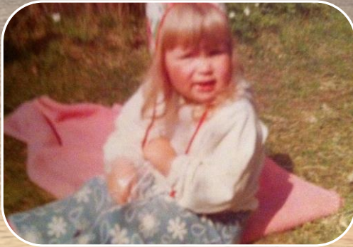
Började karriären i Falun